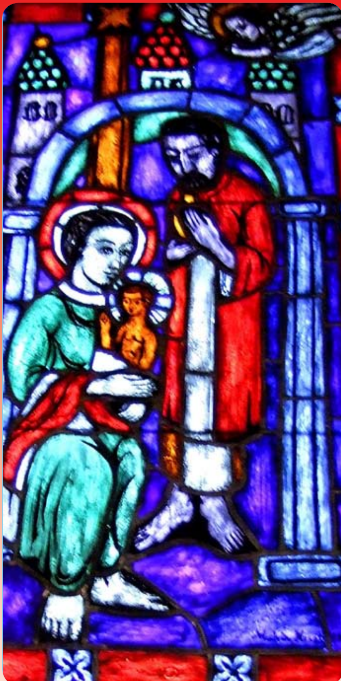
Glasmaleri i Ølve kyrkje - frå 1954: Juleevangeliet av Malvin Neset