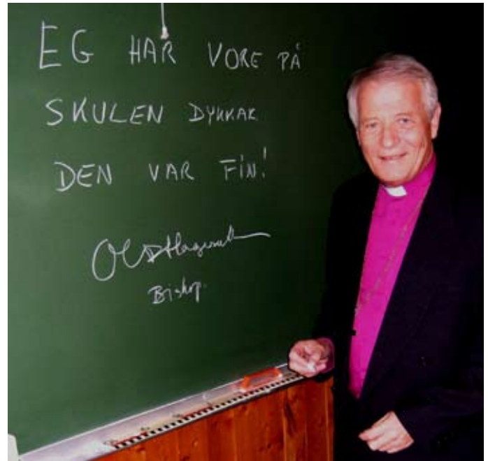
Biskopen fekk ikkje sjå kor flinke skuleborna var på sjølve visitasen, så han ville gje eit teikn frå seg til dei.

Det vart ei triveleg stund i skulen, og både gjester, soknerådsmedlemmer og vanlege kyrkjegjengarar kosa seg i lag.